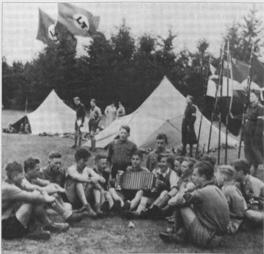
Abb. 5: Nahtlose Weiterführung ideologischer Konzepte in der Hitler-Jugend