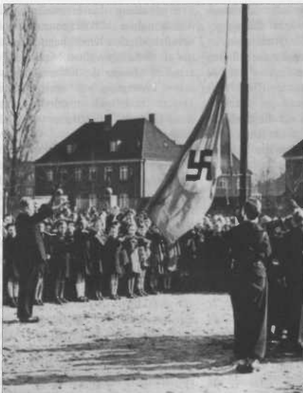
Abb. 2: Fahnenappell zum Beginn des Schultages

habe der Deutschunterricht den „Stolz auf deutsche Art wachzurufen“ und „die Kampfdichtung der nationalsozialistischen Bewegung zu berücksichtigen“. Im Erdkundeunterricht hätten „geopolitische und wehrgeographische Betrachtungen“ das „Verständnis für wichtige Maßnahmen der nationalsozialistischen Führung“ anzubahnen. „Lieder der nationalsozialistischen Bewegung“ seien im Fach Musik zu