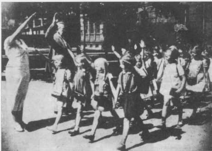
Abb. 3: Erstklässler verabschieden sich von Rektor und Lehrerin mit dem „Deutschen Gruß“

zu behandeln, wie überhaupt alles vergangene Geschehen nur deutlich machen soll, dass das Ziel der deutschen Geschichte in der „nationalsozialistischen Revolution und der Schaffung des Dritten Reiches unter seinem Führer Adolf Hitler“ liege. Wie bei den anderen Fächern fehlt auch hier nicht der Hinweis auf Formen der Schüler selbsttätigkeit sowie auf moderne Anschauungsmittel wie „Geschichtsquellen, Jugendschriften, Besichtigungen, Bilder, Filme, Karten“.