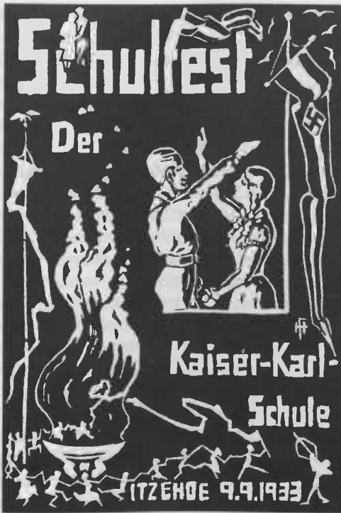
Abb. 1: Einladungspostkarte zum Schulfest 1933, Kaiser-Karl-Schule, Itzehoe

unergiebig. Entweder wurden die Ereignisse der Jahre 1933 bis 1945 schlichtweg übergangen, oder aber die Verfasser waren um persönliche Rehabilitation bemüht. 6 Analysen von Lehrerlebensläufen, wie sie für andere Länder der Bundesrepublik Deutschland durchgeführt wurden, 7 sind m. W. für Schleswig-Holstein nicht erstellt worden.